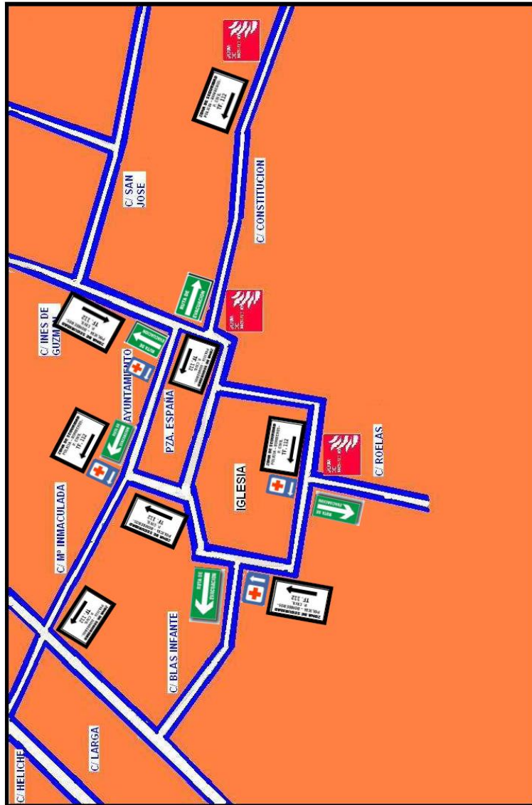
PLANO DE SITUACION DEL MERCADO BARROCO

NOTA: De los puntos 6, 7 y 8 de este Plan de Seguridad, se les hará copia y se entregará a cada uno de los afectados por el mismo, incluidos los establecimientos que están en la zona.